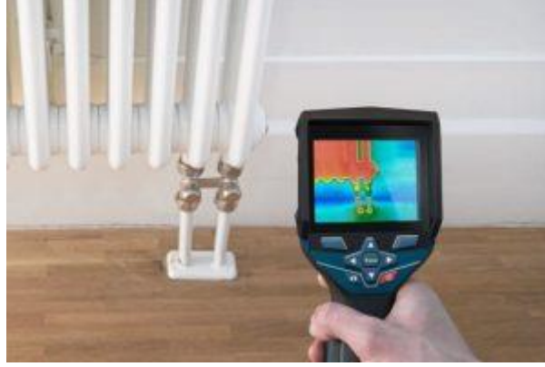
Bursa Kırmadan Su Kaçağı Tespiti Bulma

Günümüzde bu olumsuz olayların yaşanmaması için su kaçağı tespitinde uzmanlaşan bir çok firma ev ve iş yerlerinde su tesisatlarında meydana gelen su kaçağı tespitlerinde özel cihazlar kullanıldığı görülmektedir.