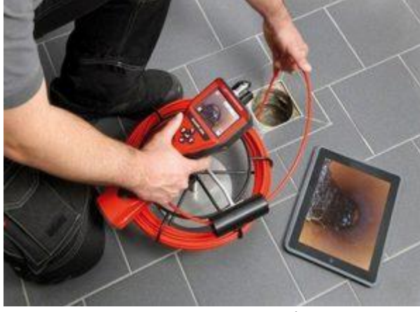
Su Kaçağı Bulma

Su kaçağı tespit cihazı adıyla anılan makineler teknolojinin en son imkanları kullanılarak tasarlandığı için bu cihazlarla “ su kaçağı bulma ” yöntemleri kırmadan, dökmeden ve kolaylıkla yapıyor.